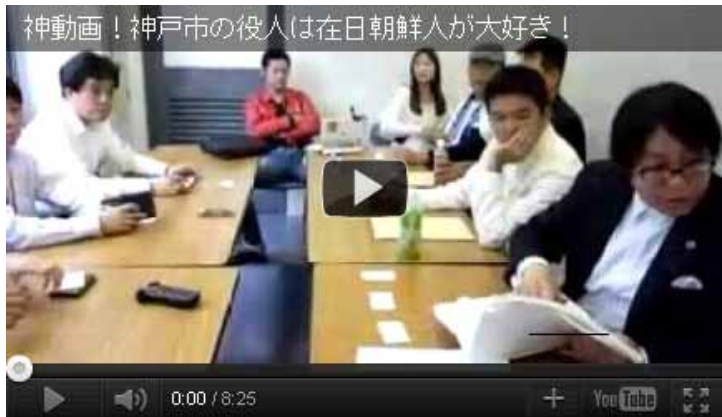
神動画！神戸市の役人は在日朝鮮人が大好き！

こうした中で、去る10月13日、在日特権を許さない市民の会とチーム関西の有志が神戸市役所を訪れ、約四時間にわたって担当者を前に抗議と公開討論会などの申し入れを行った。この模様が数日前からニコニコ動画やyoutubeにアップされて大きな反響を呼び、在特会とチーム関西の活動と行動力への評価が一段と高まっている。