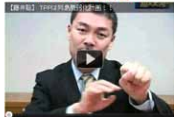
【超人大陸】藤井聡京大教授 2011 年 10 月 31 日号