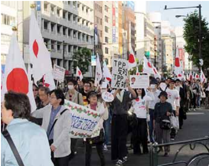
写真は 10 月 29 日に銀座で実施された TPP 反対デモ行進から

同会議は今年 2 月に発足、副代表に久野修慈氏(中央大学理事長)と山田正彦氏(衆議院議員)、世話人に金子勝、榊原英資、鈴木宣弘氏ら大学教授や各業界団体の役員 20 人が世話人に就任。TPP 関連の会議、各種資料の配付、動画配信などの事業を行ってきたが、集会やデモ行進を実施するのは今回がはじめて。