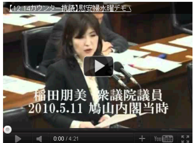
【12.14カウンター抗議】慰安婦水曜デモ vs なでしこ 主計回復を目指す会、在特会も参戦！